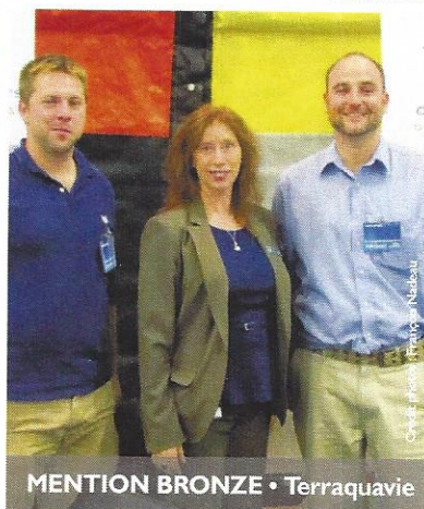
MENTION BRONZE • Terraquavie