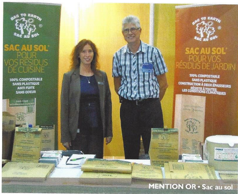
MENTION OR • Sac au sol

Ce sont les membres de l'équipe d'Écologistik, gestion responsable d'événements, qui ont agi à titre de jury de ce programme. Ceux-ci ont évalué la performance environnementale des différents kiosques selon plus de vingt critères tels que : la réutilisabilité du kiosque pour un autre événement, les matériaux qui constituent le kiosque, le transport qui a été utilisé pour le matériel et les exposants (location d'un stand sur place, impression des documents à proximité du lieu de l'événement, covoiturage des exposants, etc.), l'éclairage du stand optimisé de manière à réduire sa consommation d'énergie, (lampe basse consommation, fluo compacte, gradateur, etc.), de même que la réutilisation des revêtements de sol après l'exposition. M